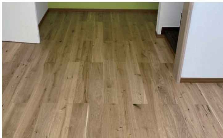
ナラ複合 CD UV 塗装