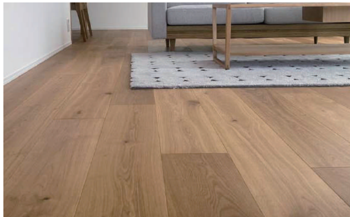
オーク3層 CD オイル塗装