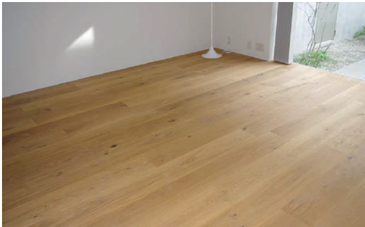
オーク複合 オイル塗装