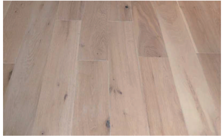
オーク複合 ABCD mix 春風ミルク色塗装