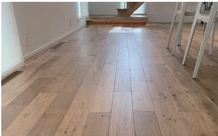
ナラ複合 ABCD mix ウレタン塗装