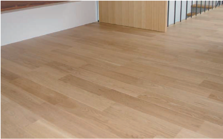
ナラ複合 ウレタン塗装