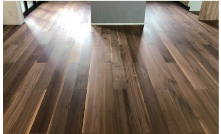
ブラックウォールナット複合 オイル塗装