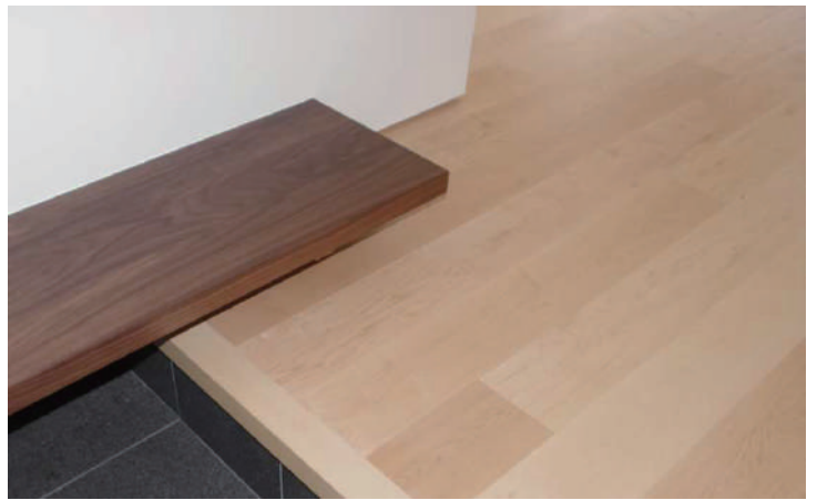
メープル複合 ウレタン塗装