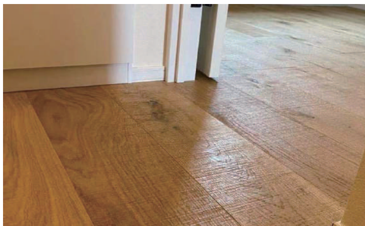
オーク3層 CD アンティーク加工 ウレタン塗装