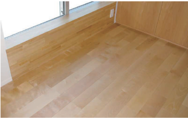
カバ複合 ウレタン塗装