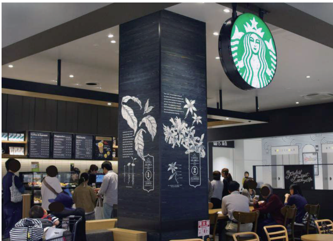
不燃材使用 / Non-combustible material

県産杉無垢を使用した羽目板材は存在感があり、装飾するなど組み合わせ素材によって藍の表情も多彩に。 The indigo coated wood wall panels are precisely the details that make a wall paneling system so attractive: with a simple installation of a single detail, you can create an extraordinarily space with this unique materials.